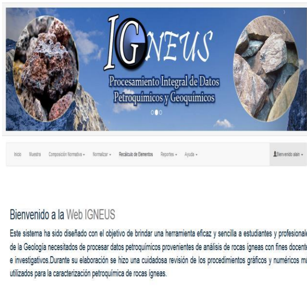
Figura. 1: Interfaz Principal de la aplicación

Con este software se logra una mayor visibilidad e interpretación a partir de gráficos y diagramas, del comportamiento de las rocas ígneas desde el punto de vista petrológico y geoquímicos de su composición normativa para predecir ambientes de formación, características petroquímicas y procesos petrogenéticos. A continuación en la figura 1 se muestra su Interfaz principal.