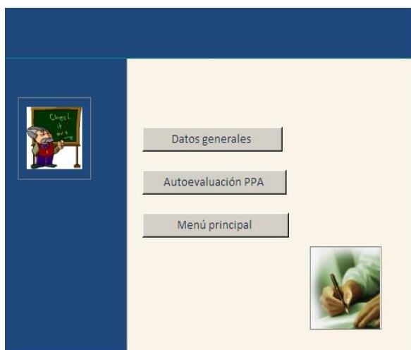
Figura 2: Pantalla de Informe

Todas las operaciones necesarias para el procesamiento de los resultados del control del desempeño profesional del profesor principal del año de las carreras de perfil técnico de la educación superior pedagógica se realizan de modo automático y se muestran cuando lo solicite el dirigente en la opción Informes, que también puede ser realizada desde el Panel de Control. Estos informes pueden ser tanto de los datos generales, como del desempeño profesional del profesor principal de año, cada uno recoge los datos procesados en diferentes dimensiones e indicadores.