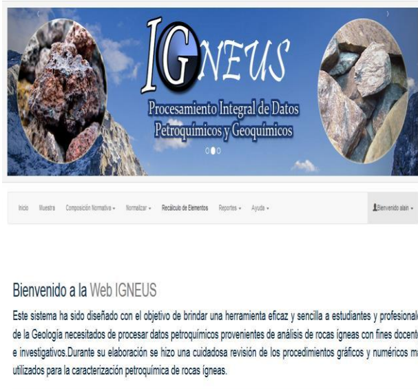
Figura. 1: Interfaz Principal de la aplicación

Con este software se logra una mayor visibilidad e interpretación a partir de gráficos y diagramas, del comportamiento de las rocas ígneas desde el punto de vista petrológico y geoquímicos de su composición normativa para predecir ambientes de formación, características petroquímicas y procesos petrogenéticos. A continuación en la figura 1 se muestra su Interfaz principal.