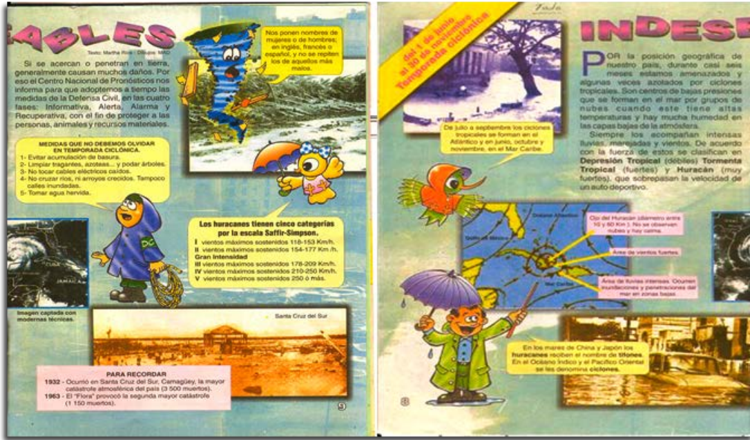
Fig.3.- Análisis del texto científico, Indeseables tomado de la Revista Zunzún, número 170.