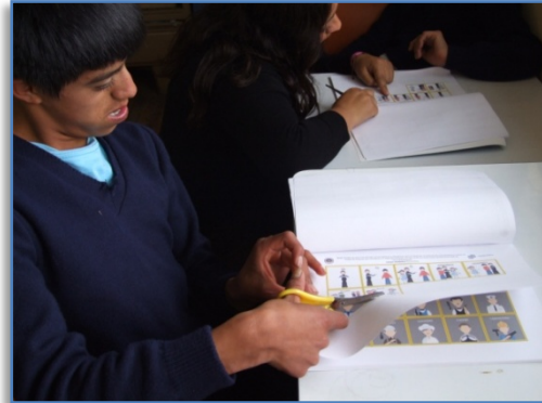
Foto 2: El educando construye una respuesta, apoyado de los pictogramas e ideogramas de la Guía Metodológica.