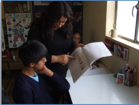
Foto 1: La Terapista de Lenguaje da una indicación o formula una pregunta.