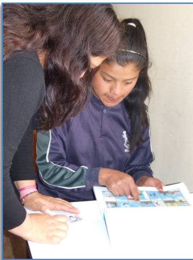
Foto 5: Cuando el desarrollo motriz no es óptimo, la guía se utiliza mediante señalamiento de pictogramas e ideogramas.