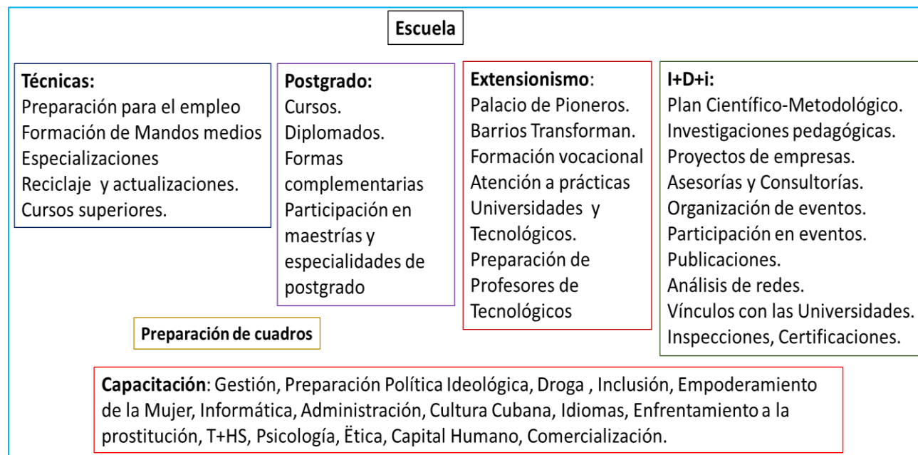
Figura 2. Complejidad de la Escuela de Turismo en Cuba.

Para validar el resultado se aplicó el Método de expertos a una sola ronda y el Test de satisfacción grupal con la preparación recibida, sobre la base de la experiencia. Fue necesario además comprender la multiplicidad de direcciones de trabajo educativo e investigativo que desarrollan los Centros de Capacitación del Turismo, lo que se grafica a continuación. (Figura 2)