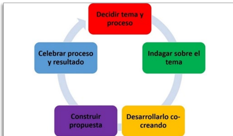
Fig.2. Fases para llevar a cabo procesos de cocreación.