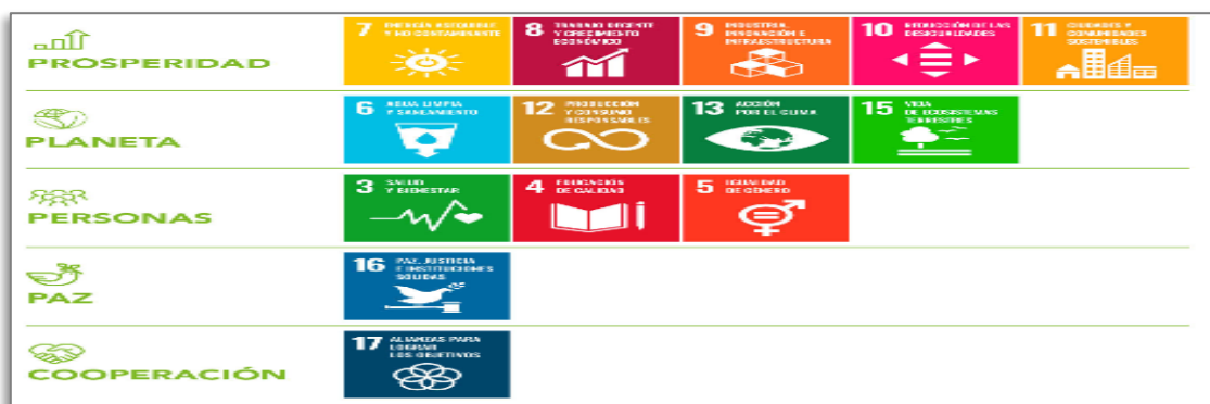
Figura 2. Vínculos de los Objetivos de Desarrollo sostenible con las principales preocupaciones de los pueblos y los gobiernos.

de los pueblos y los gobiernos. Como se muestra en la lámina siguiente; se asocia con la necesidad de “prosperidad” los objetivos del 7 al 11, con la necesidad de proteger el planeta el 6, 12, 13 y 15; con la protección de las personas los objetivos 3, 4 y 5; mientras que con la necesidad de la paz el objetivo 16, y con la cooperación el objetivo 17. (Figura 2)