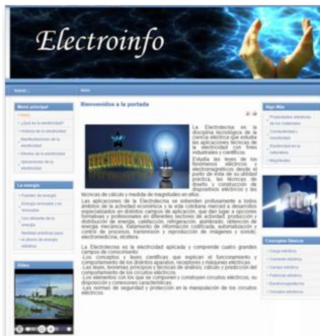
Figura 1. Sitio Web Electroinfo

En la figura 1 se muestra la página principal del Sitio Web Electroinfo.