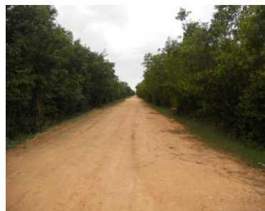
Figura1. Fotos del primer tramo del Dique desde Surgidero de Batabanó a Playa Cajío