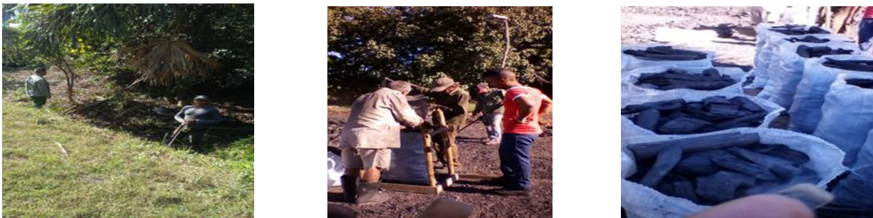
Figura 5. Fotos que muestran la limpia, el corte y la elaboración del carbón donde se emplean plantas invasoras

Por otra parte, en el proyecto de Regeneración Natural se trabaja en la limpieza de las zanjas para que el agua pueda llegar a su intercambio en la zona de mangle y las otras vegetaciones, como se muestra en la figura 5.