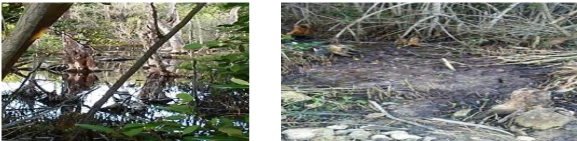
Figura 7. Fotos que muestran los efectos negativos sobre el área provocada por las prácticas del campo de Tiro de Camacho

Un serio problema que es abordado en este trabajo lo constituye una problemática sin solución, los autores se refieren a los efectos negativos sobre el Dique Sur que están ocasionando los ejercicios militares en el campo de tiro de la unidad militar de Camacho, cuyos estragos más significativos están presentes en el tramo ubicado entre los aliviaderos quinto y sexto, de camino de Surgidero a Cajío, que han desbastado gran parte de la flora y fauna de este ecosistema costero, que se evidencia en la figura7.