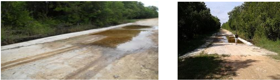
Figura 2. Fotos que muestran los aliviaderos o badenes vertiendo aguas

Comprende el beneficio de 39 badenes vertedores o aliviaderos encargados - Anexo 1- de interrumpir parcialmente el flujo subterráneo de la intrusión salina e impedir la penetración del mar y la salinización del preciado líquido bajo la superficie terrestre, mostrados en la figura 2.