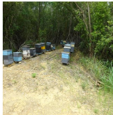
Trayecto del terraplen remodelado