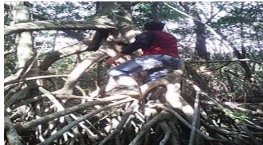
Figura 4. Fotos que muestran el desarrollo de los manglares en el área del dique

La contaminación de las aguas subterráneas por la intrusión salina debido a la sobre explotación de los acuíferos constituye un riesgo permanente en la mayor parte de las áreas de regadío que utilizan estas aguas.