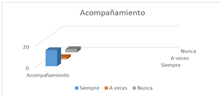
Fig. 1. Niveles de acompañamiento de los padres

En la encuesta aplicada a los decisores de la competencia, el 80% de las decisiones fueron tomadas de manera colegiada junto con el equipo, basándose en la elaboración previa de un plan de competencias. Este hallazgo indica un comportamiento colaborativo significativo entre los sujetos involucrados, destacando un reconocimiento compartido entre los niños ajedrecistas, los padres y el entrenador (ver figura 2).