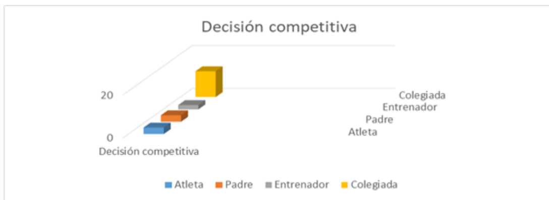
Fig. 2. Representación de los decisores de la competencia

Se aplicó una entrevista a los padres con el objetivo de valorar el autocontrol que los padres mantienen durante la competición. De los 12 participantes, el 16.7% 8 (2 padres) reconoció la necesidad de implementar estrategias específicas para trabajar el autocontrol ante posibles resultados adversos. Además, el 5% de los padres mostró inestabilidad en su autocontrol, enfocándose más en los objetivos técnicos que en resultado final. Solo el 10% admitió no lograr mantener el control emocional durante las competencias. Estos datos sugieren la relevancia de fortalecer las habilidades de autocontrol para mejorar el desempeño en el contexto competitivo (ver figura 3).