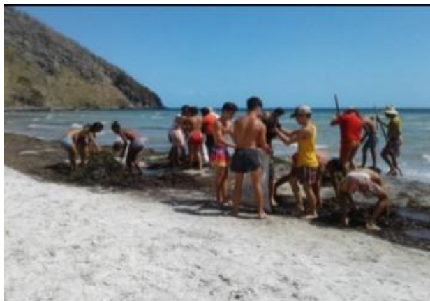
Fig. 4. Los pioneros exploradores terrestres, realizan patrullajes en el bosque en la sierra “Las Casas”, en la finca “El Abra”, Isla de la Juventud.