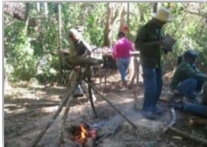
Fig. 3. Los guías y pioneros exploradores se adiestran para la supervivencia en condiciones de campaña aprovechando los recursos naturales como legado de las ideas de Fidel.

Este propio escenario sirvió para que Fidel reconociera los efectos negativos que los fenómenos naturales y la actividad humana le ocasionaron al lugar, provocando erosión, pérdida de la diversidad biológica y una activa deforestación que lacera las bellezas naturales de las montañas y del río de la zona. Al mismo tiempo, hace un llamado a los pioneros para enfrentar y evitar esas prácticas negativas que ponen en riesgo la existencia de la vida humana; aspectos incorporados desde entonces, al accionar del MPE.