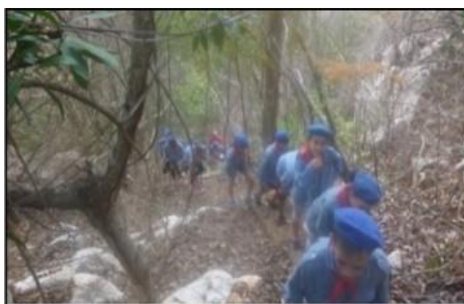
Fig. 5. Los exploradores marinos, realizando labores de limpieza, de las costas de la playa Paraíso y las márgenes del río Las Casas, Isla de la Juventud.

La observación realizada a diversas actividades del MPE en los colectivos pioneriles y en el centro de Exploradores “Amistad con los Pueblos” de la Isla de la Juventud, permitió corroborar cómo los miembros de este movimiento, rinden tributo al pensamiento ambientalista de Fidel Castro. Entre las actividades más significativas observadas se encuentran: