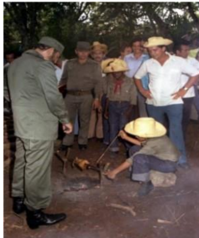
Fig. 2. Los pioneros exploradores demuestran a Fidel habilidades aprendidas para la vida en campaña, durante la inauguración de los centros de exploradores Ramón Paz Borroto, de Granma y Comandante Pinares, de Pinar del Río.