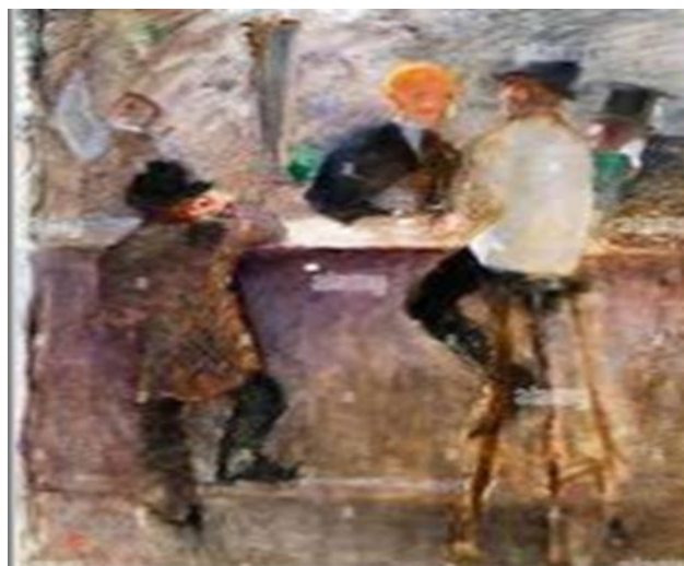
Autorretrato en la taberna 2

Se evidencia en la apreciación visual de estas pinturas y al comparar los hallazgos disímiles en el componente conceptual de estos artistas de la plástica en relación con el consumo desde épocas pretéritas, que la adicción es un padecimiento crónico, recurrente y progresivo que origina consecuencias nocivas. Se advierte desde el impacto artístico su prevención, fundamentalmente en los jóvenes de hoy, con la intención de reivindicar y articular una labor educativa y pedagógica en el proceso de enseñanza-aprendizaje.