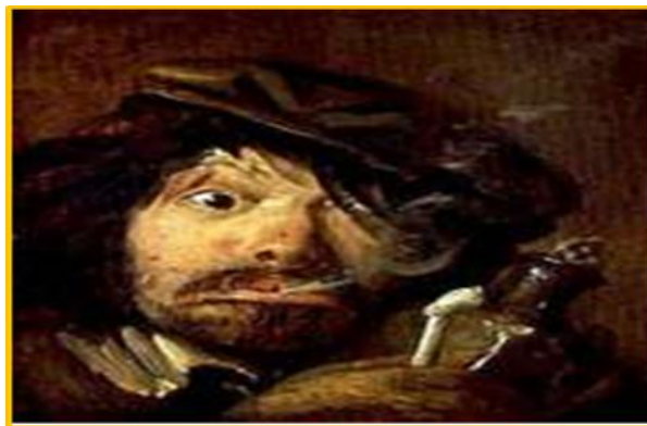
Figura 1. El fumador, de Adriaen Brouwer Fuente: (Vigué, 2008, p.17)

La relación entre las conductas adictivas en la producción artística es otra visión de la relación arte-consumo alcohólico y tabáquico, de modo tal que su dependencia ha sido un comportamiento asumido por los artistas para crear sus obras desde épocas vetustas, como se refleja en la figura 1.