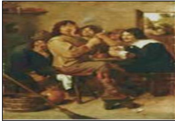
Figura 2. El fumador, 1636 Brouwer Adriaen

La pintura representa un autorretrato de Brouwer. Desde el punto de vista circunstancial, afloran características higiénicas y ambientales de una taberna sucia y desorganizada. En esta pieza, los personajes —un grupo de jóvenes artistas— están fumando y consumiendo cervezas en una sugerente imagen de disfrute y diversión, típico de la primera etapa de la embriaguez (Vigué, 2008, p. 18).