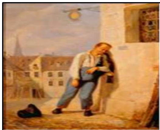
Figura 3. El borracho de Carl Spitzweg.

En la figura 3 se observa el vicio del alcohol.