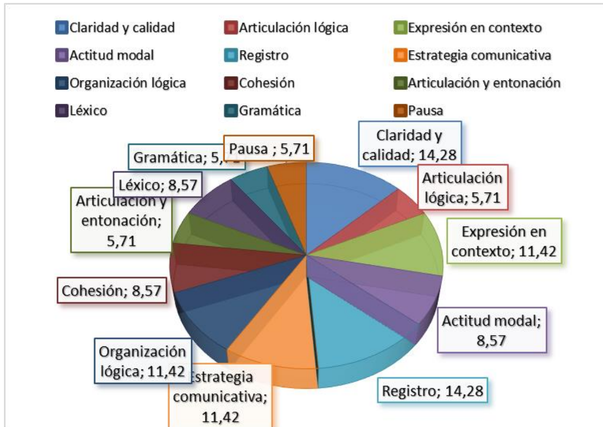
Gráfico 3. Desarrollo constatado en la prueba pedagógica inicial

Como fortaleza se plantean los indicadores de: claridad de las ideas, el registro estilístico, las estrategias comunicativas, la organización lógica y la expresión de significados considerando el contexto. Las debilidades constatadas se relacionan con la cohesión, la expresión de actitud modal y el léxico. Sin embargo, persisten como reto el uso de la gramática, las pausas necesarias, la articulación lógica, la articulación y la entonación, por lo que se requiere continuar implementando actividades relacionadas con la expresión oral en aras de mejorar estos indicadores.